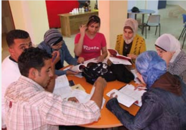
* كتاب «النزاهة والشفافية والمساءلة في مواجهة الفساد»، من إصدارات امان، بين أيدي الطلبة الجامعيين

وداع لرئيس الممثلة الهولندية السابق السيد فرانس ماكين ولنائبة الممثلة النرويجية السيدة جريتا لوخن الذين غادرا الممثلين خلال العام.