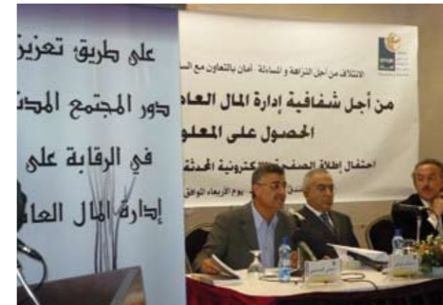
* حفل إطلاق الصفحة الإلكترونية لوزارة المالية

وفي النشاط الثاني، وهو احتفال الشفافية، بلغ عدد المشاركين نحو 300 مشارك ومشاركة. وقد عقدت "أمان" ذلك الاحتفال في قاعة احد الفنادق برام الله والتي تتسع لنحو 200 شخصا بالإضافة الى 100 من الحضور من قطاع غزة شاركوا عبر الفيديو كونفرنس. الامر الذي يشير الى مدى الاهتمام والرغبة بالمشاركة