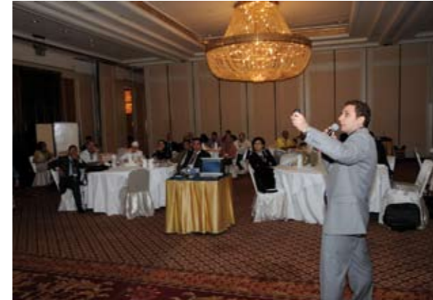
* مشاركة في الفعاليات الخارجية لأحد المشاريع

لمست "أمان" الاحترام والمشاركة والتفاعل من قبل الممولين. حيث تبادلت "أمان" موليتها هذا الاهتمام باستمرار وحافظ على العلاقة وتشارك في المناسبات. فعلى صعيد التنسيق والتعاون مع مولي البرنامج الرئيسي. حكومة ملكة النرويج وحكومة ملكة هولندا. دُعيت "أمان" من جهة وموليتها من جهة أخرى الى الاجتماعات فتم ذلك بين المكتب التمثيلي للنرويج والمكتب التمثيلي لهولندا كلما كان ضروريا. كما نظمت "أمان" لقاءات