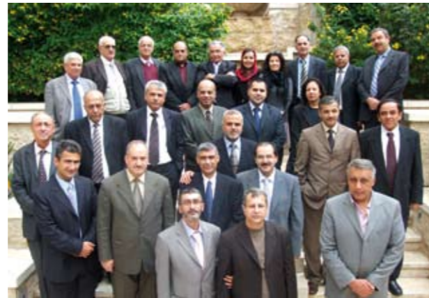
* القضاة يشاركون في أنشطة امان

وعلى صعيد تنمية قدرات الطاقم. تم إعداد خطة لتطوير الكادر بناء على عملية تقييم الأداء ودراسة احتياجات المؤسسة مقارنة بقدرات الطاقم الموجودة. وقد تم العمل على تنسيب معظم الموظفين للإلتحاق بدورات تدريبية محليا ودوليا. إضافة لتنسيبهم للمشاركة بالنشاطات المحلية والإقليمية.