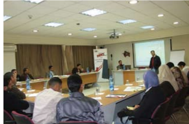
* ورشة تدريبية

وعند التركيز على الأنشطة التشاركية الأكثر تكرارا وهي التدريب (حلقات، ورش، ندوات، دورات). يتضح أن المعدل هو 23 و 25 على التوالي. الرقم الاول يعتبر ايضا مُرضيا بالنسبة لـ "أمان" (من حيث المشاركة) ويبقى في اطار ضمان المشاركة الفعالة وتوكيد الجودة في المخرجات. الرقم الثاني هو كذلك مُرضٍ كمعدل على اعتبار انه الطاقة الاستيعابية المثالية لـ "أمان". وعلى اعتبار انه يضمن المشاركة الفعالة والعادلة لهذا العدد في اطار زمني قدره ساعتين تقريبا كما افادت التجربة المتكررة (5 دقائق تقديم، 20 عرض، 85 مداخلات بمعدل 3.5 للمشارك الواحد، 5 توصيات و5 ختام).